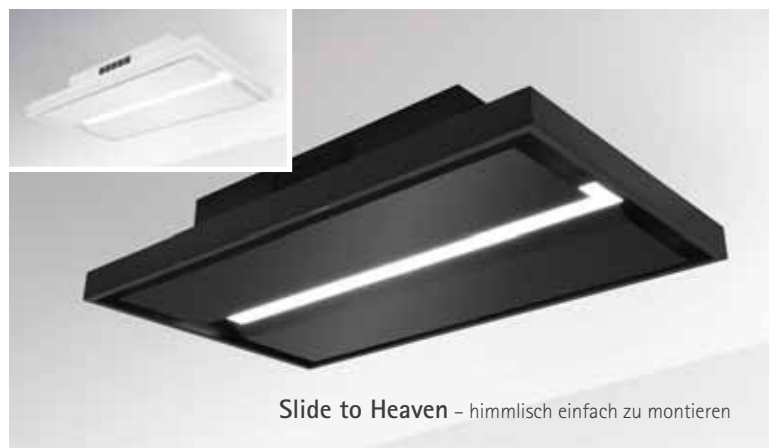
Slide to Heaven – himmlisch einfach zu montieren

licht in ihren natürlichen Farben erstrahlen. Unterschiedliche Design-Motive öffnen den Raum wie ein Fenster und geben den Blick auf Naturmotive frei. Einfach auszutauschende, bedruckte und leicht durchscheinende Plexiglas-Platten sorgen für natürliche Schatten und Reflexionen. Durch einfaches Öffnen der Randabsaugungsplatte – auch für den Wechsel der Edelstahl-Fettfilter vorgesehen – kann die Plexiglas-Platte im Handumdrehen gegen ein anderes Motiv ausgetauscht werden. So kann ganz nach Wunsch das Design der Deckenhaube verändert werden. Im Auslieferungszustand ist die Sky Door mit einer matten, neutralweiß beschichteten Plexiglas-Platte ausgestattet, die für eine minimalistische und dezente Lichtszene sorgt. Weitere 4 Design-Motive in den Optiken Sky, Wood, City und Water sind als Sonderzubehör erhältlich.