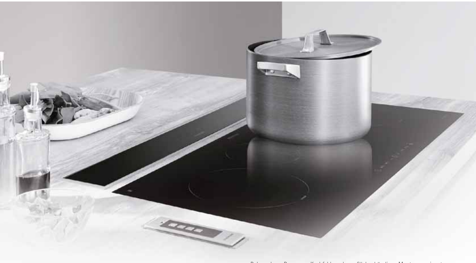
Rahmenloses Panorama-Kochfeld, auch zur flächenbündigen Montage geeignet

Auch in einem anderen Bereich arbeitet das Kochfeld selbstständig: Es erkennt die Topfgröße und erhitzt nur den Teil, der notwendig ist. Sicherheit wird selbstverständlich großgeschrieben – wenn kein Topf auf dem Kochfeld steht, schaltet es automatisch ab. Das gilt auch für den Fall, wenn eine Kochzone über eine ungewöhnlich lange Zeit genutzt oder extrem belastet wird.