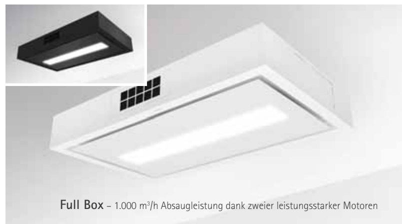
Full Box – 1.000 m 3 /h Absaugleistung dank zweier leistungsstarker Motoren

Sämtliche Deckenhauben sind mit der komfortablen Fernbedienung „FB 2“ inklusive Edelstahl-Einbaurahmen für den flächenbündigen Einbau in die Arbeitsplatte ausgestattet. Dank zweier Infrarotaugen ist die Dunstabzugshaube mit der Fernbedienung steuerbar und wird mittels eines Magneten im Einbaurahmen fixiert. Durch leichtes Schieben nach vorne kann sie aus dem Einbaurahmen entnommen und die Leistungsstufen, das Licht oder die Nachlaufautomatik können aus allen Winkeln der Küche bequem und einfach geschaltet werden.