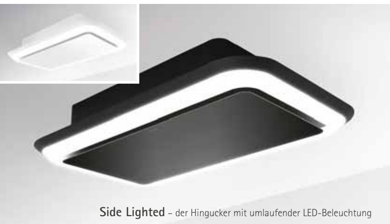
Side Lighted – der Hingucker mit umlaufender LED-Beleuchtung

Die SILVERLINE Deckenhaube Side Lighted besticht durch ihre außergewöhnliche Form und ihre umlaufende LED-Beleuchtung. Mit speziellen Abrundungen setzt sie in Sachen Produktdesign neue Maßstäbe. Dank der schnörkellosen Gestaltung und der klaren Formen wirkt die Haube sehr zurückgenommen und integriert sich har-