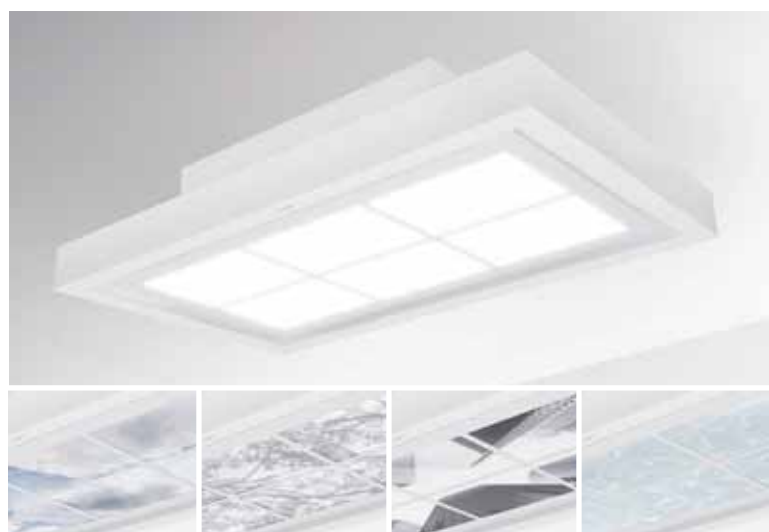
Sky Door – die einzigartige Deckenabzugshaube in Fensteroptik

Sky Door vereint einen hocheffektiven Dunstabzug mit einer flächendeckenden Ausleuchtung der Küche. Die Deckenabzugshaube in Fensteroptik überzeugt durch ein einzigartiges Beleuchtungskonzept und lässt die Küche durch ein großflächiges virtuelles Tages-