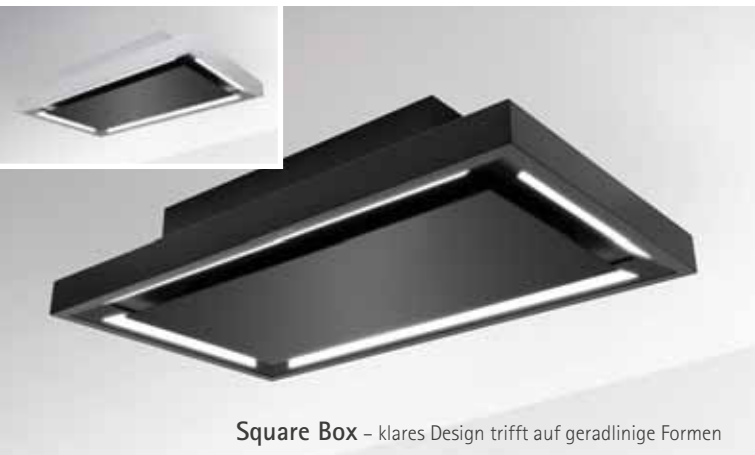
Square Box – klares Design trifft auf geradlinige Formen

D ank niedriger Energiekosten und hoher Ressourcenschonung liegen Passiv- und Niedrig-Energie-Häuser zu Recht im Trend. Kontraproduktiv wäre es allerdings, in solchen Häusern Dunstabzugshauben mit Abluft zu verwenden, welche die gesparte Energie quasi wieder aus dem Fenster pusten. Die optimale Alternative sind in diesem Fall Dunstabzugshauben mit Umluft-Technik – denn sie filtern Fette, Kondensate und Gerüche aus den Kochwrasen heraus und leiten die gereinigte Luft wieder zurück in den Raum. Wärmeverluste werden so vermieden und die positive Energiebilanz bleibt erhalten. Ist dann noch der freie Blick z. B. von der offenen Küche in die Wohnräume erwünscht, dann sind die neu entwickelten Umluft-Deckenlüfter Square Box, One Stripe, Light Box, Full Box, Slide to Heaven, Side Lighted und Sky Door von SILVERLINE die perfekte Lösung.