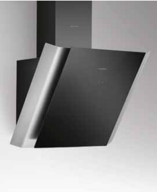
Der neue Maßstab für Benutzerfreundlichkeit: die Laura

M it der Wandhaube Laura hat SILVERLINE eine Kopffreihaube entwickelt, die nicht nur einen perfekten Blick auf das Kochfeld bietet, sondern auch Design-Akzente setzt. Mit ihren geradlinigen Formen sowie der Materialkombination aus Edelstahl und schwarzem Glas ist sie optisch ein absolutes Highlight. Die Laura überzeugt zudem durch ihre technischen Werte: Zwei sparsame LEDs beleuchten das Kochfeld optimal und verbrauchen dabei nur 6 Watt Strom – das schont Umwelt und Portemonnaie. Für ein angenehmes Raumklima sorgen die hocheffiziente Randabsaugung sowie der leistungsstarke Motor, der mit 650 m 3 /h freiblasend die Luft rein hält. Mit