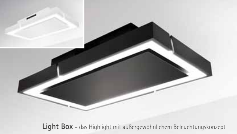
Light Box – das Highlight mit außergewöhnlichem Beleuchtungskonzept

Durch eine Magnetbefestigung ist auch die Entnahme des Aktivkohle-Wabenfilters spielend einfach. Der Aktivkohle-Wabenfilter ist bis zu 10-mal im Backofen regenerierbar, kann also für 11 Einsatzperioden verwendet werden.