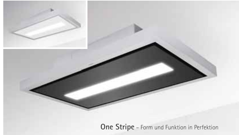
One Stripe – Form und Funktion in Perfektion

Die Deckenlüfter bieten durch den Umluft-Betrieb eine größtmögliche Flexibilität bei der Montage, da keine Abluftführungen installiert und Decken nicht extra abgeköffert werden müssen. Und auch die Montage der SILVERLINE Geräte selbst ist jetzt noch einfacher geworden, da alle 7 Modelle völlig neu konzipiert wurden. Die Umluft-Hauben bestehen nun aus 2 getrennten Bauteilen: einer Motor-Box mit darin liegendem Motor und dem eigentlichen Gehäusekorpus. Zur Befestigung sind nur 2 Schritte notwendig: Erst wird die Motor-Box unter der Decke angebracht und anschließend der Gehäusekorpus – fertig! Der Vorteil: Die getrennten Bauteile sind wesentlich leichter als die gesamte Deckenhaube inklusive des Motors, sodass die Montage ohne größere Anstrengung von 1 bis 2 Personen realisiert werden kann – im Gegensatz zur Montage herkömmlicher Hauben, für die in der Regel 3 Personen benötigt werden.